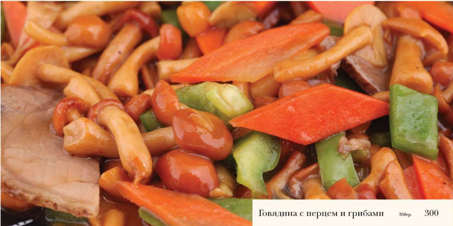
Говядина с перцем и грибами