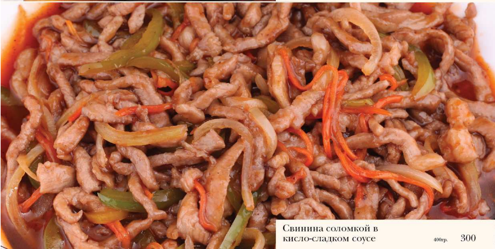
Свинина соломкой в кисло-сладком соусе