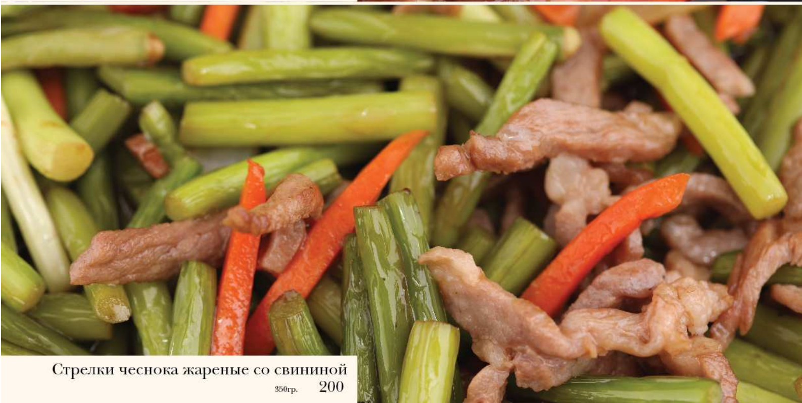
Стрелки чеснока жареные со свининой