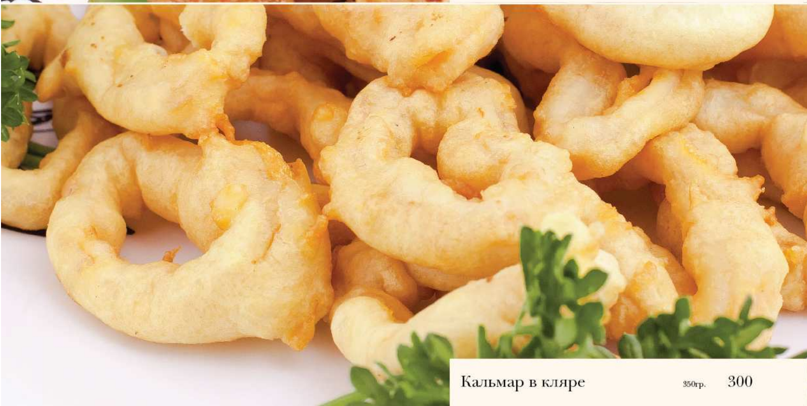
Кальмар в кляре