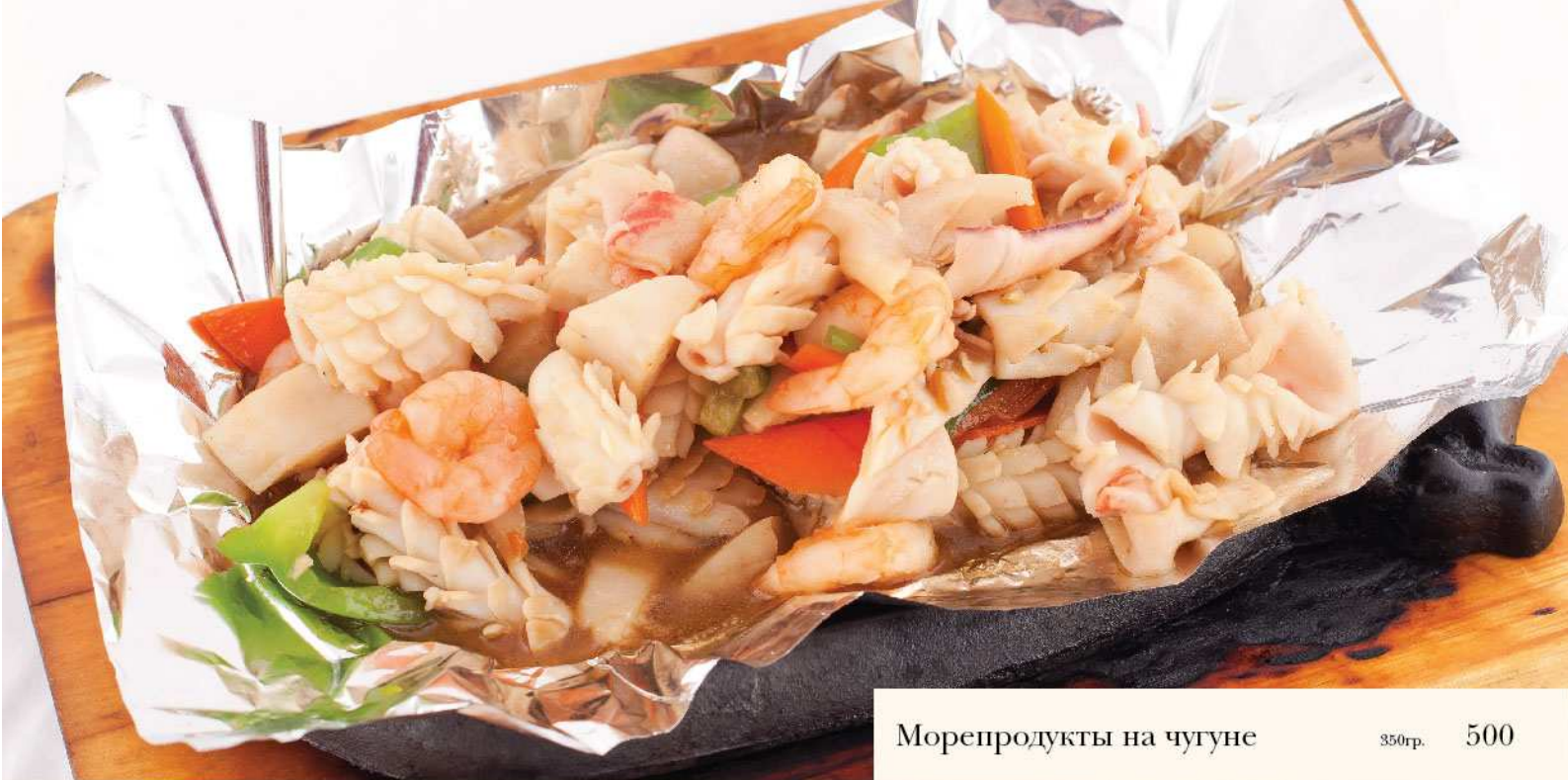
Морепродукты на чугуне