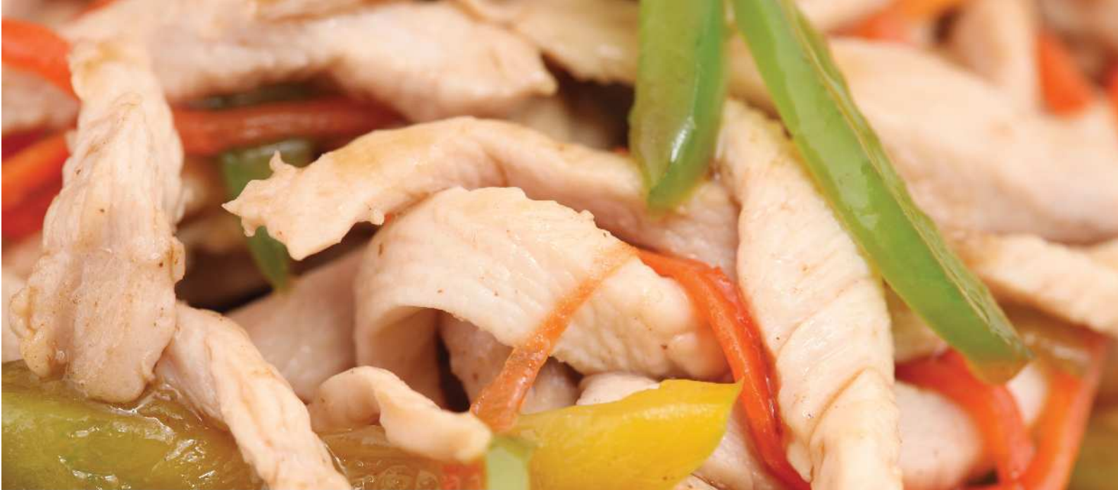
Филе соломкой с овощами острое в кисло-сладком соусе 400гр. 280