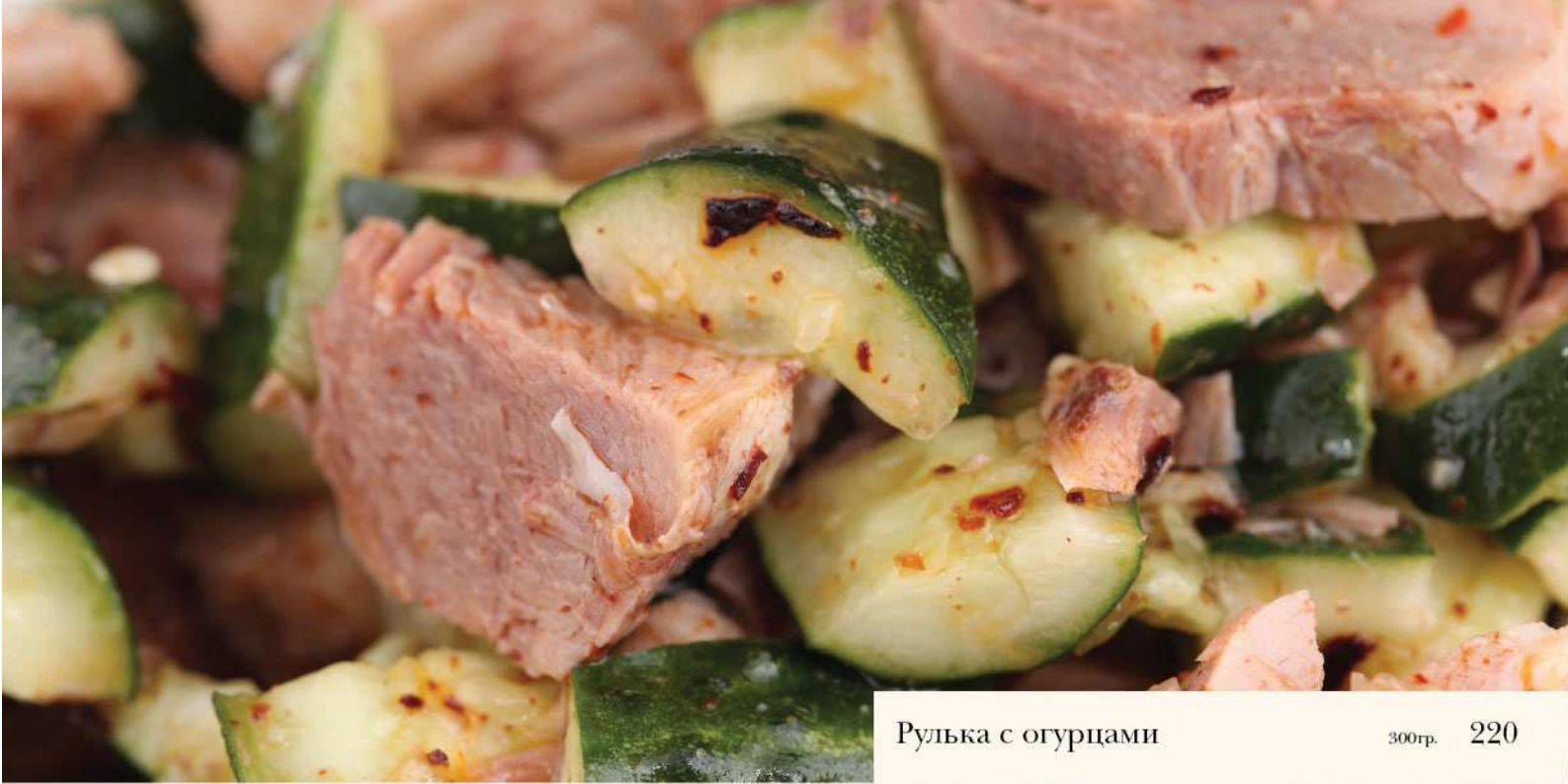
Рулька с огурцами