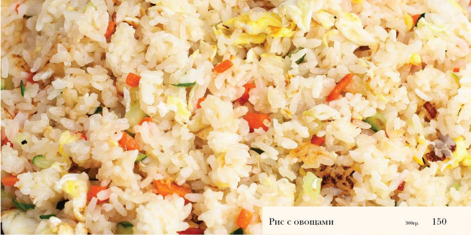
Рис с овощами