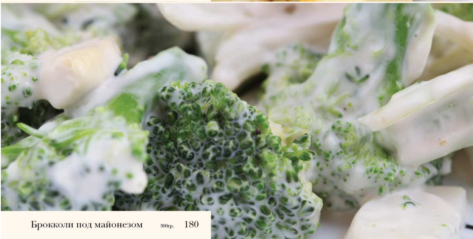
Брокколи под майонезом