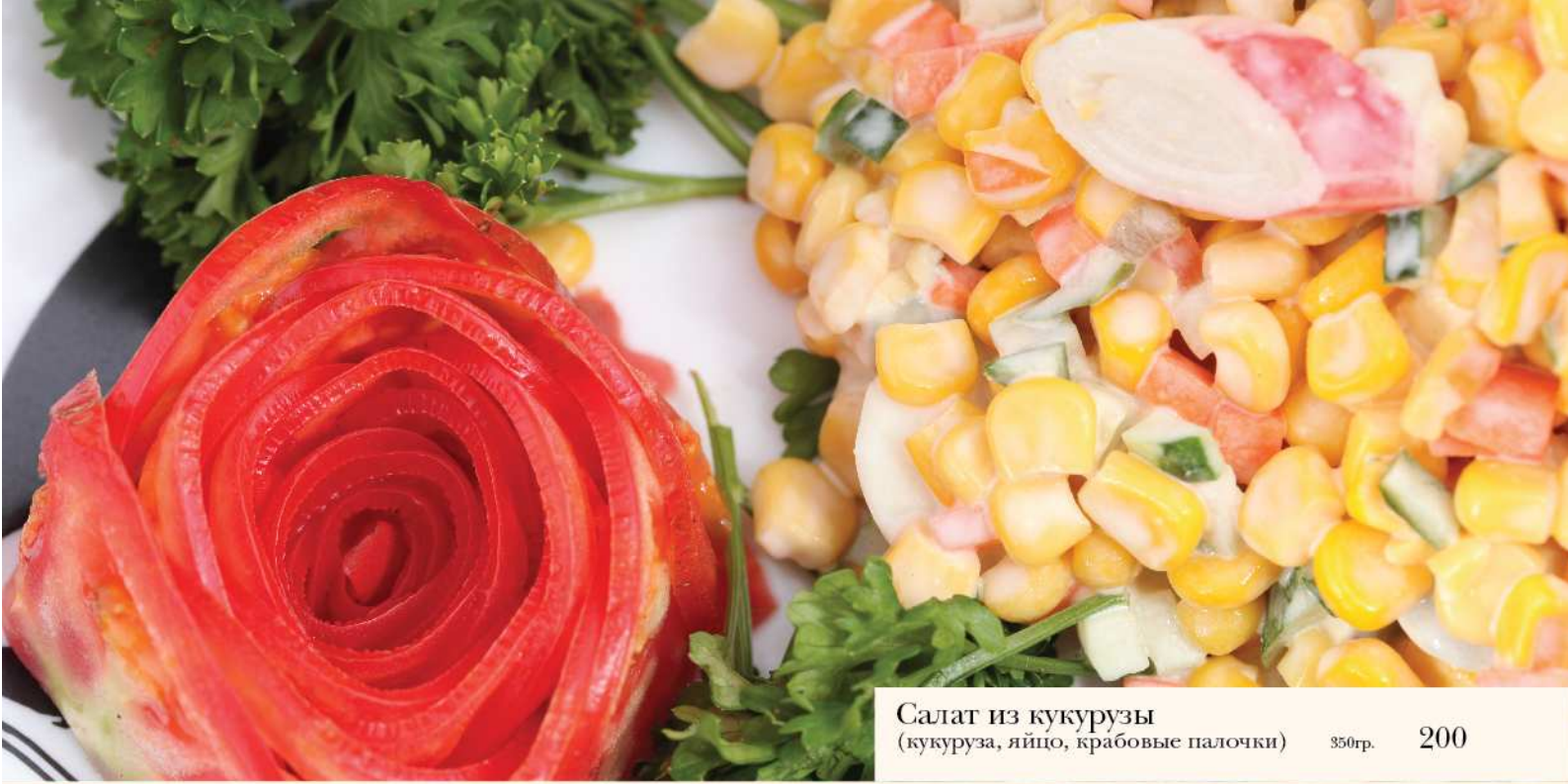
Салат из кукурузы (кукуруза, яйцо, крабовые палочки) 350гр. 200