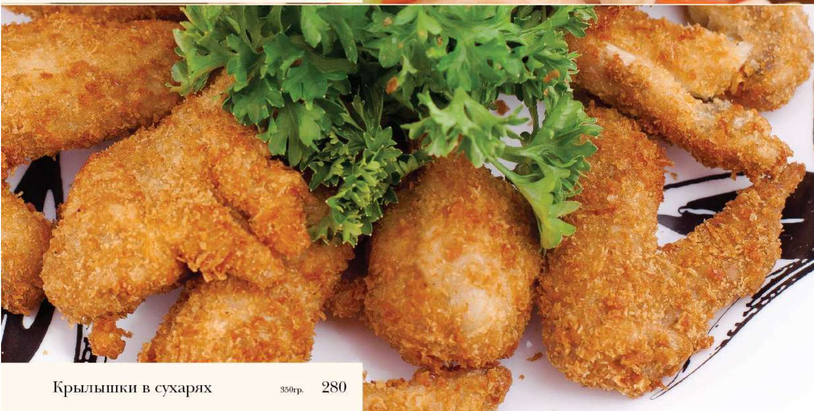
Крылышки в сухарях 350гр. 280