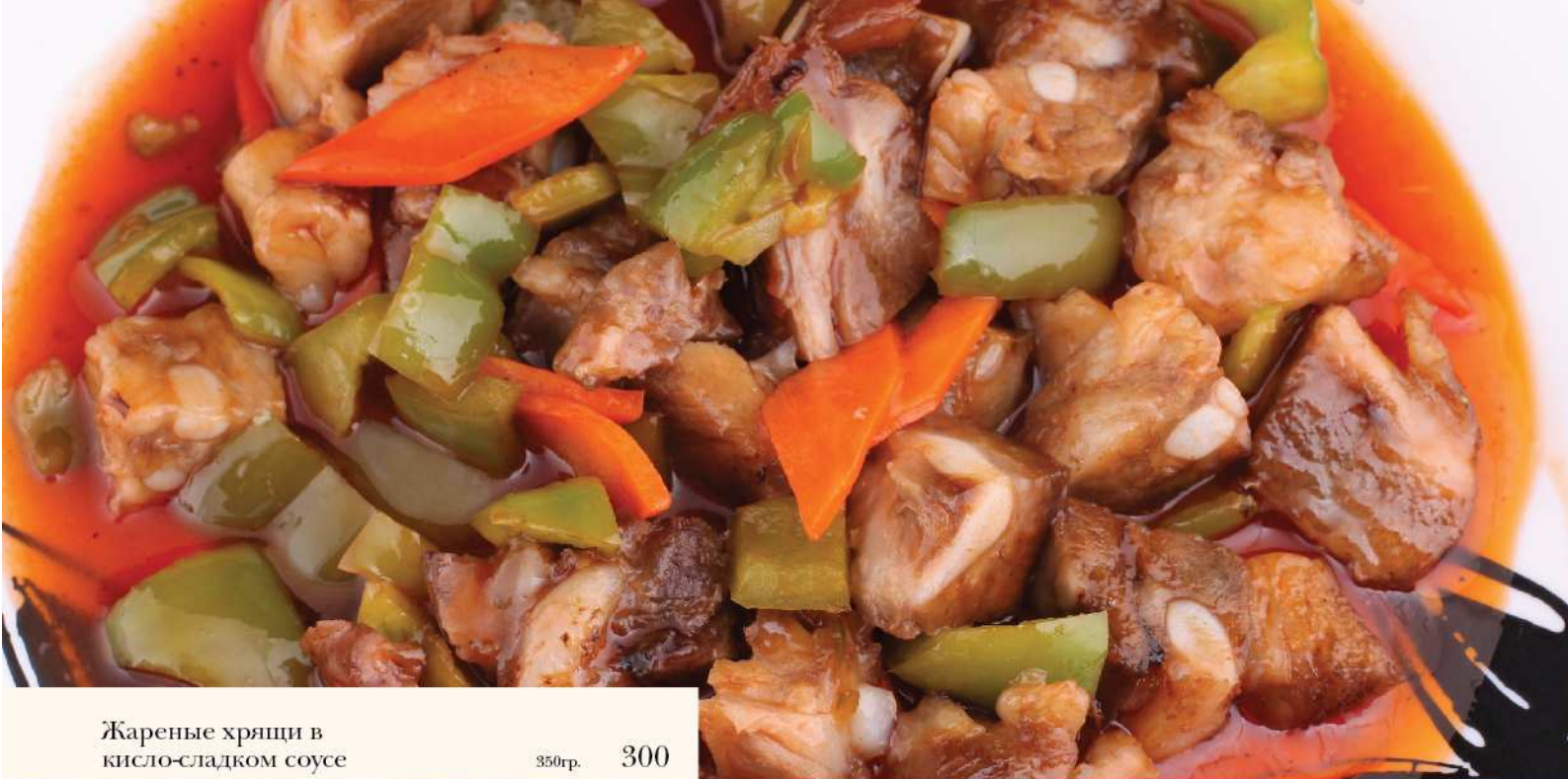
Жареные хрящи в кисло-сладком соусе