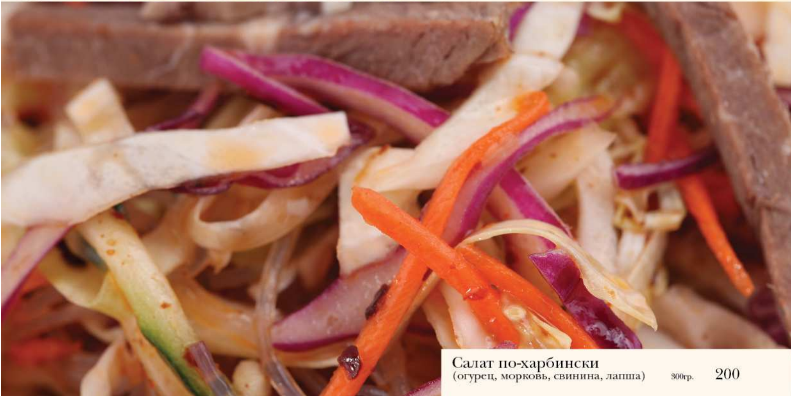
Салат по-харбински (огурец, морковь, свинина, лапша) 300гр. 200